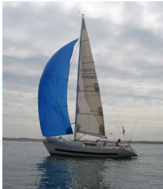
Diabolo, bateau fétiche!

Poussés par une exaltation religieuse sans limite, puis pour des raisons commerciales, les traversées sont banalisées.