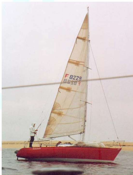
Mon premier coursier, Sidewinder, déjà un plan Andrieu!

C'est pour tout cela que je suis inscrit à la Transquadra.